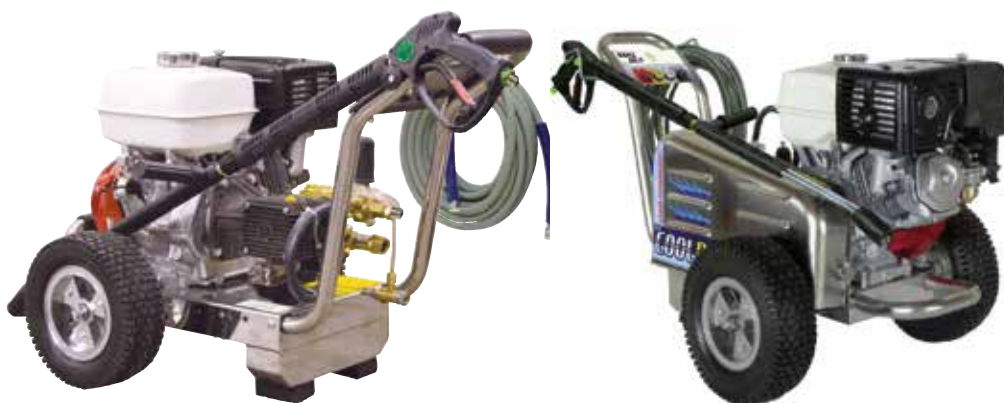
BENZ 280/15 SP95